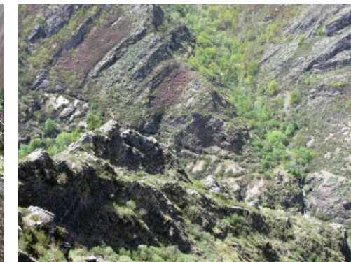
Minas y calicatas mineras en el fondo el valle de San Gil. Es posible la existencia de granitos en esta zona, lo que daría origen a los yacimientos de wolframio y de otros minerales metálicos que se encuentran en el entorno.