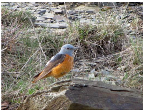
ROQUERO ROJO ( Monticola saxatilis ), habitante habitual de los riscos de Peña Trevinca y del puerto de Fonte da Cova.