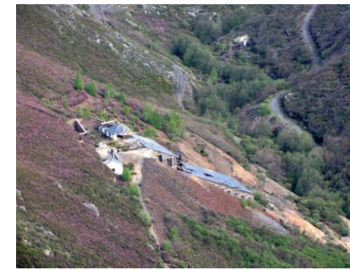
Lavadero de las minas con seis niveles de trabajo. A la parte alta llegaba el mineral en bruto en vagonetas. Después, por gravedad, pasaba a través de diferentes procesos: molienda, lavado, decantación, etc. Finalmente, las mesas vibradoras separaban los minerales pesados. El wolframio quedaba diferenciado del resto de los materiales por ser mucho más denso.