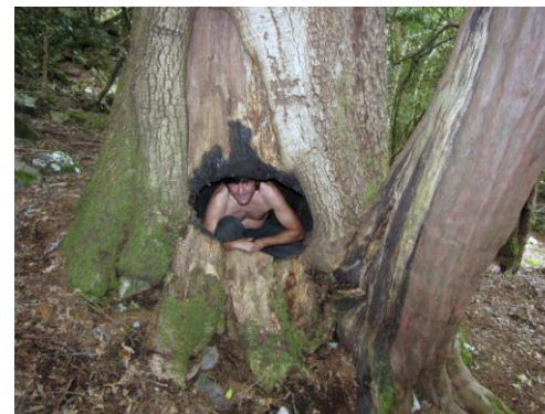
Roble de 4,10 metros de perímetro, medido a 1,20 m del suelo, y tejo adosado a él de 1,35 m. Probablemente nacieron juntos, pero el roble ya es anciano y está en fase de senectud, mientras, el tejo es todavía muy joven y vigoroso.