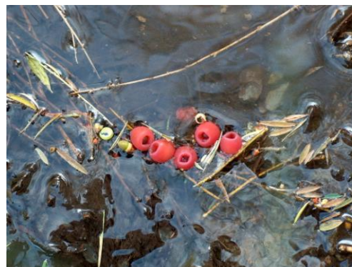
Arilos o bayas comestibles, solo proporcionadas por los ejemplares femeninos de Tejo. Solo es comestible el fruto rosado externo de consistencia gelatinosa, la semilla interna se debe escupir por ser tóxica.