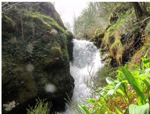
Arroyo de Penedo precipitándose en una de las numerosas cascadas y crecido por la fusión de nieve el 12 de mayo de 2012. En primer término, a la derecha, las hojas de la Lilium martagon o azucena silvestre que desprenden un olor fétido característico.