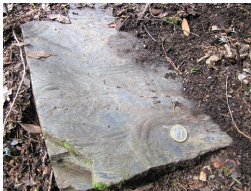
Un afloramiento de cuarcita de edad ordovícica, deja canchales de forma tabular sobre el suelo de Teixadal. La foto muestra huellas de pistas de trilobites conocidas como crucianas , testigos de que las rocas que estamos pisando, pertenecieron al fondo de un mar remoto.