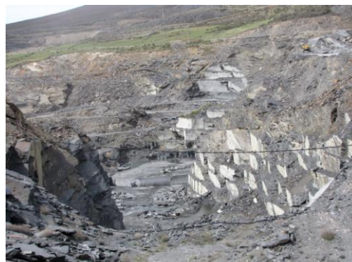
Canteras operativas en las inmediaciones de la ermita nueva de San Gil. Las canteras han generado mucha riqueza en la comarca pero se ha pagado un alto tributo medioambiental.