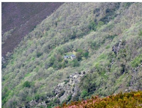
Ermita vieja de San Gil (o San Xil). Es lugar de peregrinaje con romerías el 1 de septiembre. Tiene mucha devoción en la comarca de Valdeorras. La dificultad de los accesos propició que, en 1973, se construyera una ermita nueva más accesible y cerca del pueblo de Casaio.