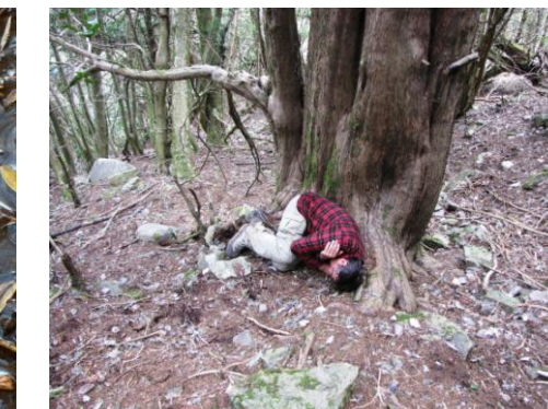
El tejo es un árbol que está sobre la tierra desde mucho antes que el hombre. Debemos respetarlo, conservarlo y venerarlo. Tenemos mucho que aprender de sus hábitos para sobrevivir en las condiciones más adversas.