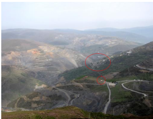
En los círculos se señalan el pueblo de Casaio y la ermita nueva de Sal Gil. La explotación de canteras rodea todo el pueblo de Casaio, que permanece como una isla verde en un mar de color gris pizarra.