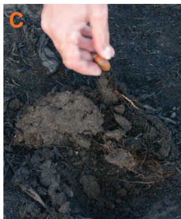
Unha landra en cada buraco