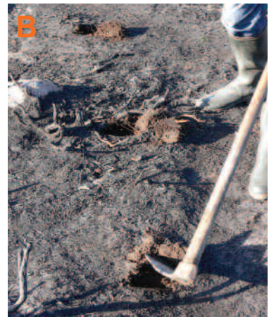
Un golpe a cada paso