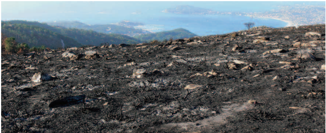
Os incendios continuados poden provocar a desertificación da terra

Os bosques que agora temos son os restos que aguantaron nas fragas, xunto coas extensións de bosque noviño formado por árbores de menos de 30 anos. Despois do mínimo histórico da segunda metade do século XX, os bosques comezaron unha lenta recuperación do terreo perdido por causa do despoboamento do medio rural e do conseguinte abandono da terra.