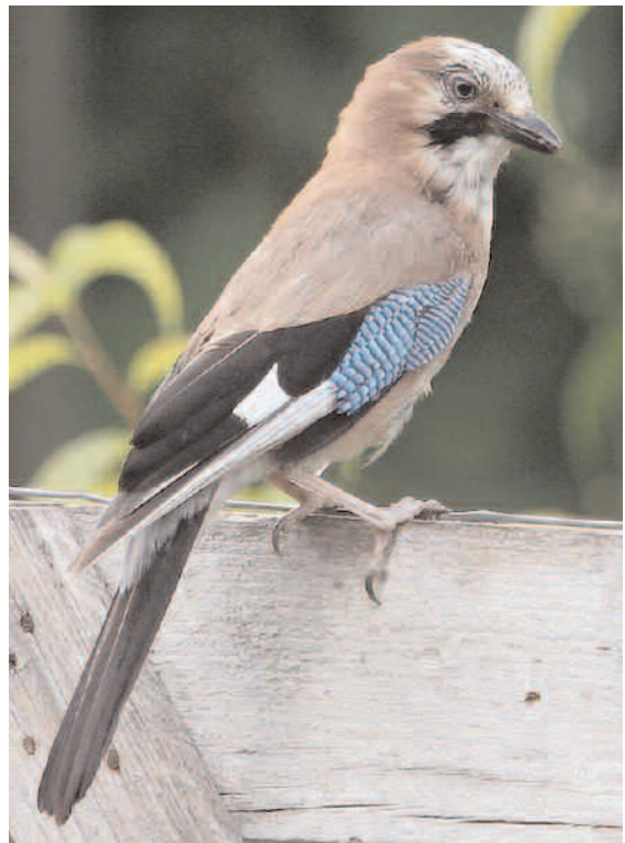
Gaio ( Garrulus glandarius )

“O gaio é o principal sementador de landras e castañas dos bosques da Europa atlántica.”