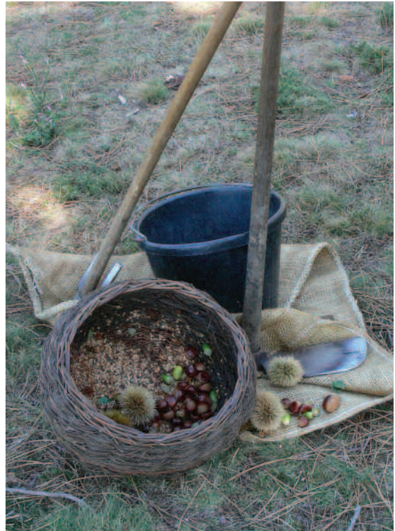
A sementeira sinxela non require de equipamentos sofisticados

Trátase de un método completamente manual, que evita os graves danos que produciría o uso de maquinaria nos solos que sufriron o lume. Tampouco non require de sofisticados equipamentos nin de coñecementos previos sobre ecoloxía forestal. O traballo organízase en grupos de dúas persoas (unha delas adulta) e calquera grupo, cunha mínima organización, pode facelo. Constitúe, sen dúbida, o método mais simple, barato e efectivo para frear a degradación da nosa terra.