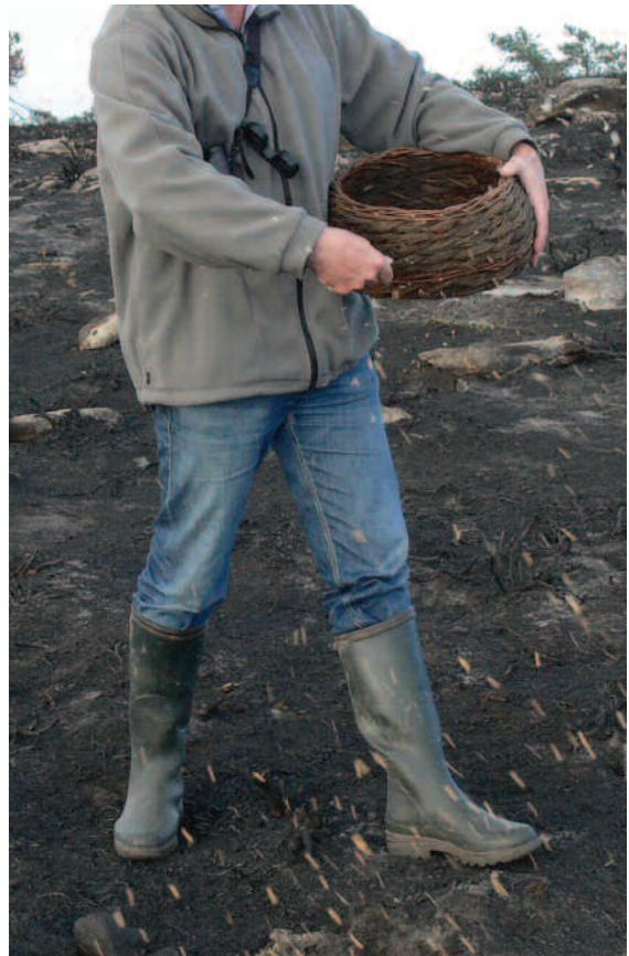
Os froitos de bidueiro seméntanse ao chou