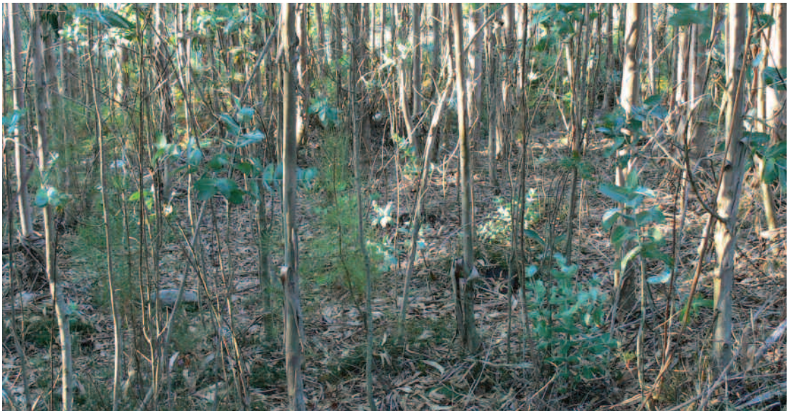
Moitas das plantacións de árbores están abandonadas

“Entre o 5.000 e o 3.000 antes de Cristo Galicia contaba xa con extensións considerables de terras deforestadas por causa dos incendios.”