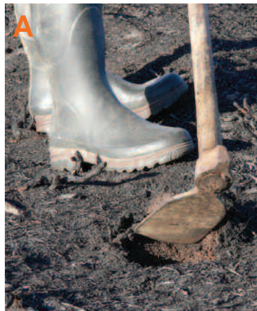
Abonda cun golpe de sacho

Como orientación, levade conta de que, dependendo do terreo, cada itinerario de 150 pasos lle pode levar 30 minutos a unha parella de persoas non afeitadas ao traballo no campo (unha parcela de 1000 m 2 lles levaría 5 horas). Nunha terra boa unha parella afeitada o traballo labrego pode plantar un itinerario en menos de 10 minutos.