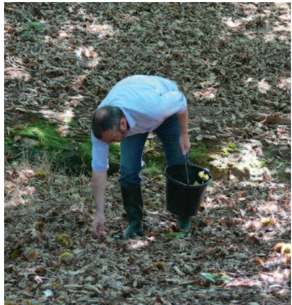
O mais doado é recolleitar do chan

Tanta como se poida. A densidade de plantación prevista é dunhas 15.000 landras e castañas por hectárea. Para se facer unha idea, 1.500 landras pesan ao redor de 5 kg e teríamos abondo para sementar 1000 m 2 de superficie. En troques, 1 kg de semente limpa de bidueiro leva mais de 1.000.000 de froitos, cantidade abondo para unha hectárea. Non obstante, o bidueiro fructifica sen necesidade de polinización polo que é posible que unha porcentaxe considerable dos froitos sexan estériles.