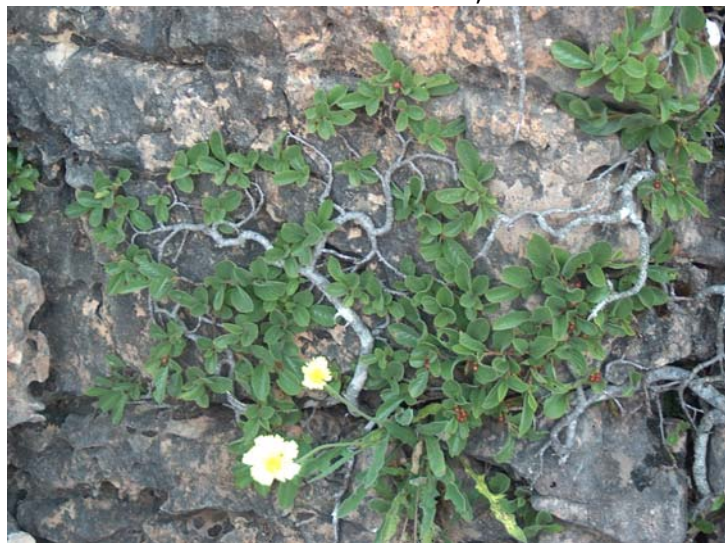
Rhamnus Legionensis Rothm

La Petrocoptis viscosa es un endemismo estricto de la Comarca Berciana siempre sobre rocas calcáreas extraplomadas, citándose su presencia en las Peñas de Ferradillo, Paradela, Chana y en los muros del castillo de Cornatel, formando comunidades muy escasas calificadas como "muy vulnerables" en la lista del Consejo de Europa.