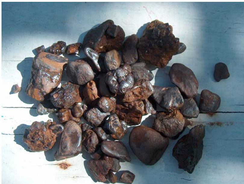
Nódulos de hierro que se obtienen en algunas zonas de las Peñas de Ferradillo al descomponerse las calizas que la componen.

Ya con criterios de mayor rigor científico, nos remitimos al interesante libro del título: La toponimia de la zona arqueológica de Las Médulas , de Fernando Bello Garnelo, que tras rigurosos estudios y trabajos de campo arroja importantes datos sobre la toponimia de Ferradillo y otros muchos pueblos y lugares del entorno de las primeras estribaciones de los Aquilianos.