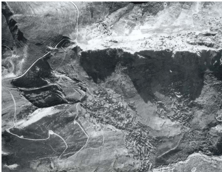
Foto aérea de Ferradillo tomada en octubre de 1980