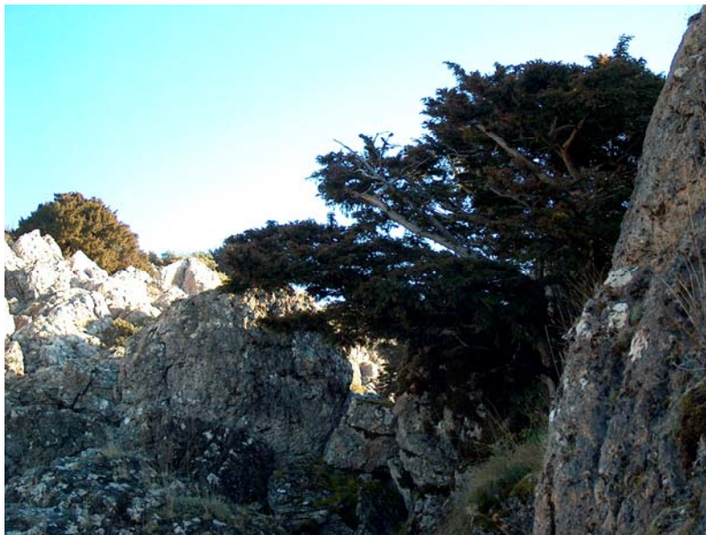
Taxus baccata L. (Tejo rupícola)

Son de destacar las comunidades relicticas de las Petrocoptis sobre acantilados calizos, verdaderas maravillas de la Comarca Berciana y por tanto de la flora Leonesa. La Petrocoptis viscosa se distribuye en los acantilados calizos extraplomados con abundante humedad.