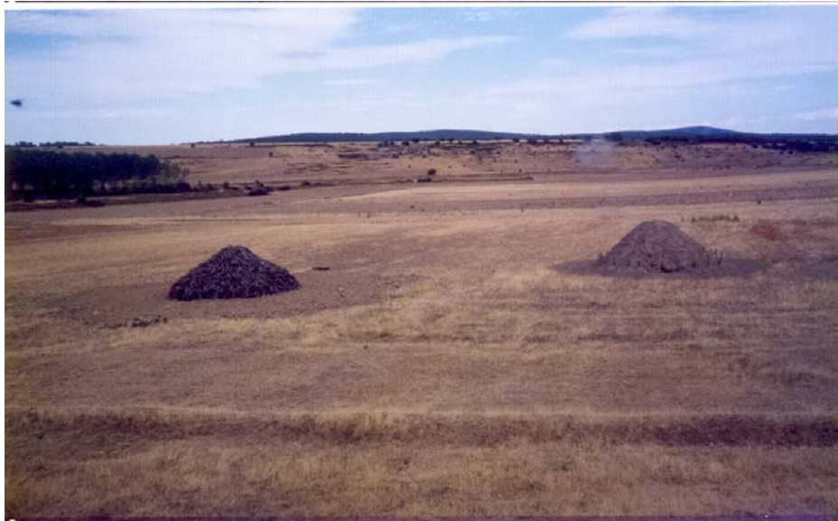
Fabricación de carbón vegetal a partir de madera de roble el Valdespino – Maragatería- en el año 1996. El montón de la izquierda está sin tierra y el de la derecha con ella.

mas tarde a los hogares ponferradinos antes de la aparición de carbón mineral.